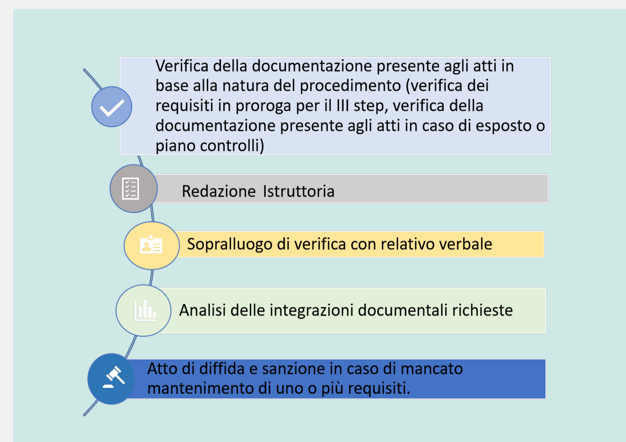
Figura 3 – Iter di accreditamento e vigilanza

Durante le attività di vigilanza, qualora si accerti un mancato mantenimento di uno o più requisiti autorizzativi si procede a diffidare e ad emettere successiva sanzione amministrativa ai sensi dell'art. 27 quinquies della L.R. 33/09.